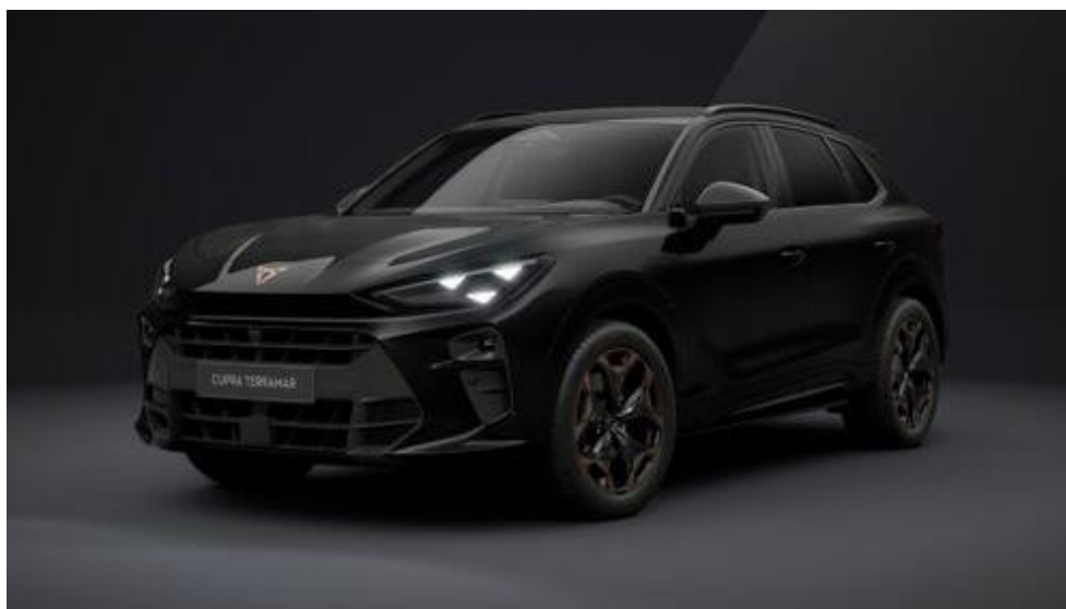
· slika je informativni prikaz vozila i ne mora u potpunosti da odgovara opisu opreme u ponudi